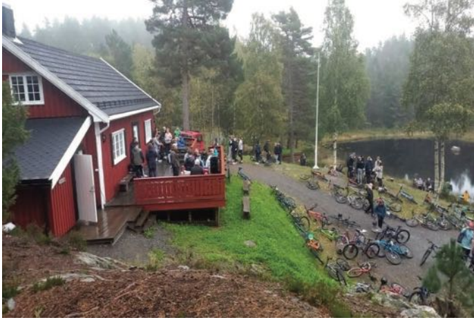
Besøk av Stinta Ungdomsskole

Sistst år hadde vi økning på 16.000 fra året før. I år som de siste årene har Agder Teaterverksted leid hytta i 14 dager. Utover det har vi hatt 2 ganger besøk av Sandnes IL, Bibelskolen 3 gange. I tillegg Arendal Kommune, konfirmasjoner og selskaper Vi har også skoler som overnatter ute.