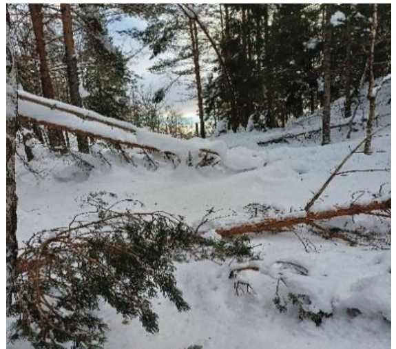
Løypa ned til Nesheim i januar

Hvem kan glemme vinteren 2024, som for alvor startet nyttårsaften