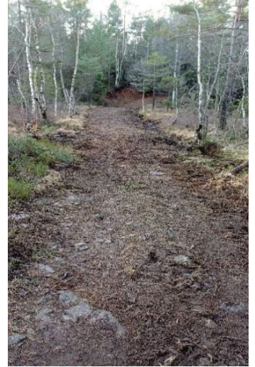
Elgmyr - før - etter - og planert uten grus.